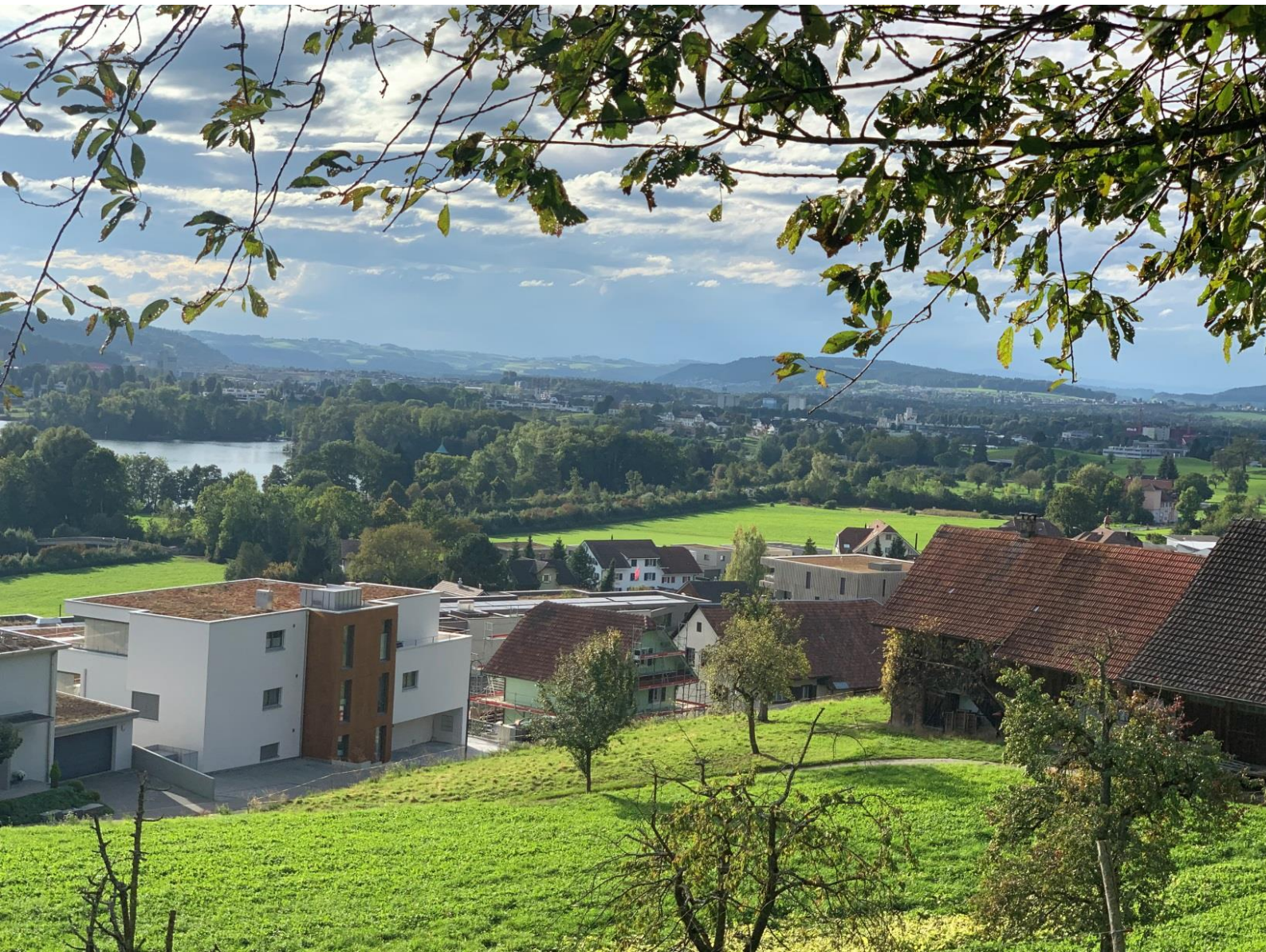
Sicht auf Arealüberbauung Burg

Donnerstag, 28. November 2019 19.30 Uhr Begegnungszentrum Schenkon