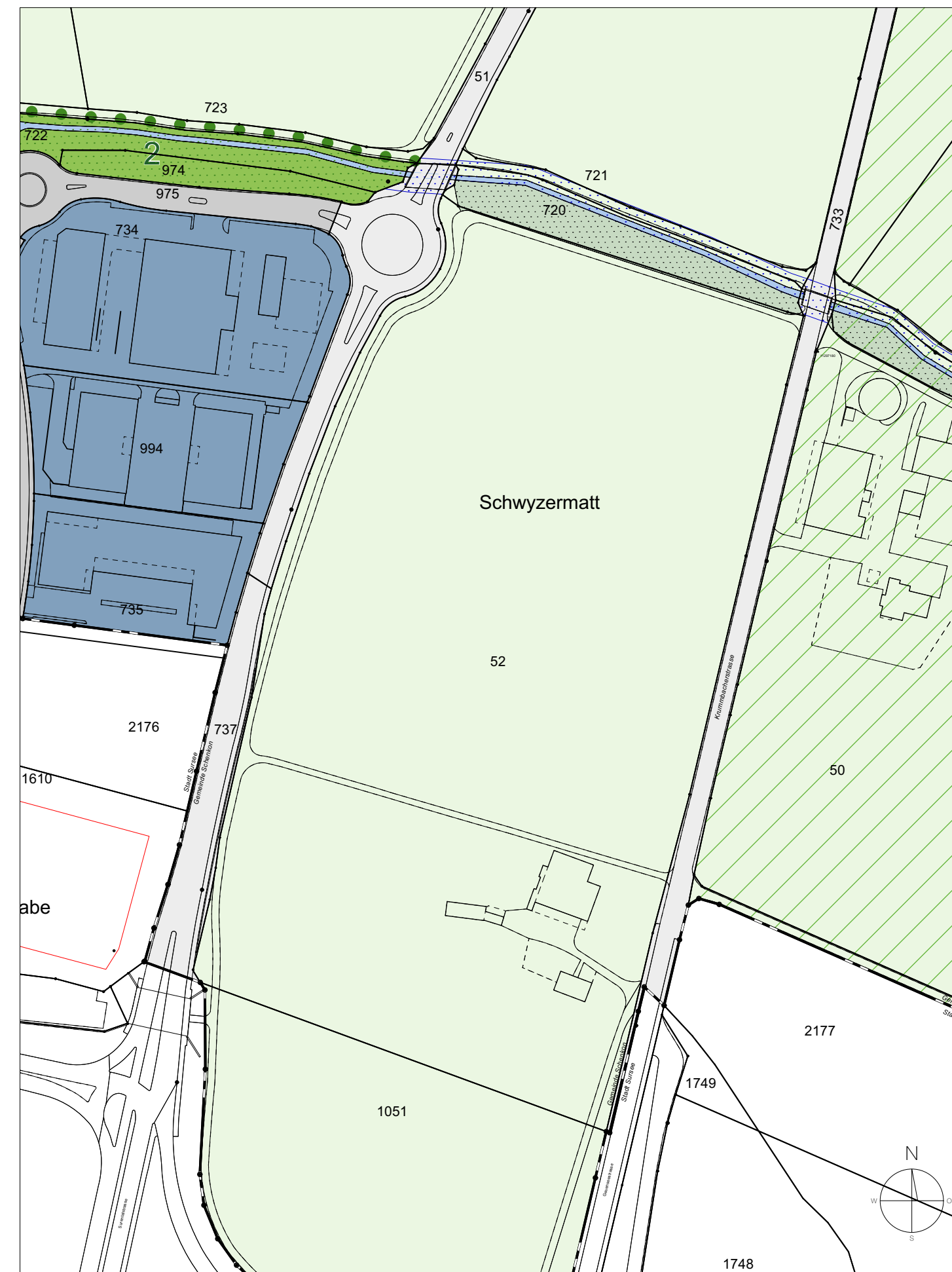
Ausschnitt Rechtskräftiger Zonenplan 1:2'000